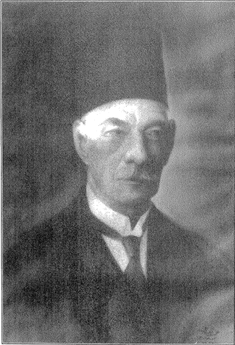
سعد زغلول رمز ثورة شعب مصر وكفاحه عام ١٩١٩ وأول رئيس وزراء من الشعب